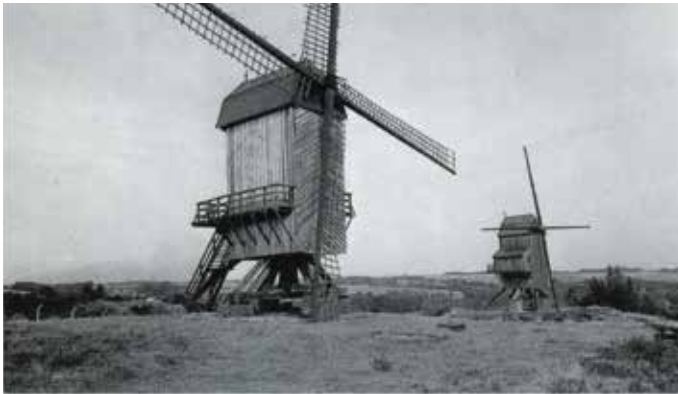
Twee molens te Naours (Somme). Rechts de molen afkomstig uit Stavele.

IJzerstraat t.h.v. de Sint-Jan-Onthoofdingskerk | Prijs : € 25