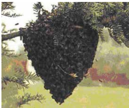
Zo ziet een bijenzwerm eruit

Andere imkers in en rond Alveringem kunnen zich ook bij ons aansluiten.